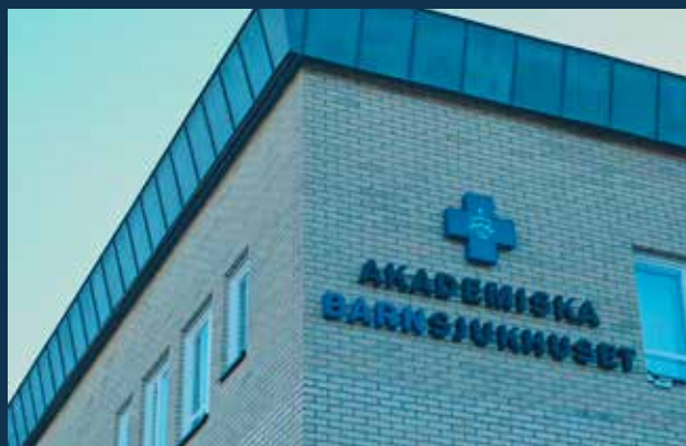
Akademiska Sjukhuset Region Uppsala

Projektet färdigställdes enligt plan och godkändes vid besiktning.