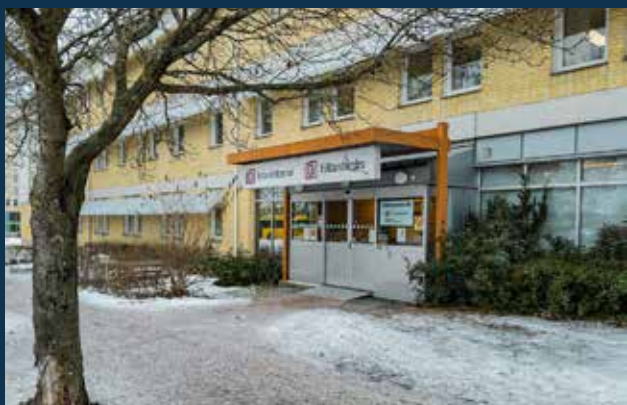
Årsta Vårdcentral Region Uppsala

Projektet bestod av total relining av hela fastigheten under pågående verksamhet. Arbetet omfattade 12 stående stammar, komplett samlingsledning, samtliga 74 patientrum, 40 handfat och 16 WC/badrum samt installation av grenförstärkningar på alla påstick. Bottenplatta ca 200m relining alla med grenförstärkning.